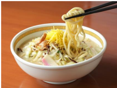
長崎ちゃんぽん発祥の「四海樓」のちゃんぽん