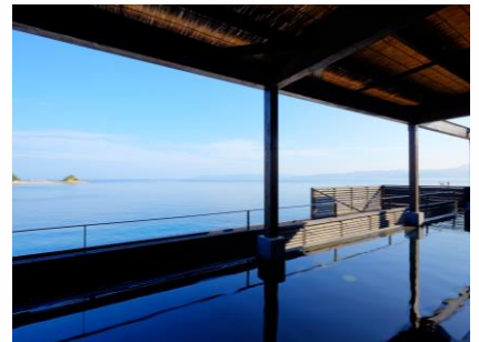
i+Land nagasaki (伊王島)