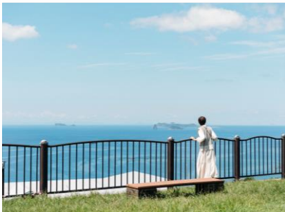
道の駅 夕陽が丘そとめからの眺望

潜伏キリシタン関連世界文化遺産！絶景の海と出津集落！ フランス宣教師「ド・ロ神父」の軌跡を辿る！ JR長崎駅 = <車50分> = 外海エリア/見学 黒崎教会、出津集落（教会堂・ 8：10 9：00/10：30 救助院）、遠藤周作文学館、道 の駅夕陽が丘そとめ等 長崎本場のちゃんぽん 明治日本の産業革命遺産「世界文化遺産」 軍艦島の上陸クルーズ = 長崎市内（昼食） = 軍艦島上陸クルーズ/長崎港～端島～長崎港 11：30/12：30 13：00/16：30頃 ビュッフェ、和食、バーベキューなど 選べる夕食！ === <車40分> = 伊王島/温泉と夕食 === 17：10/19：20 カナダから日本に上陸した「魔法の宝石を探す体験型 マルチメディア・ナイトウォーク」 === アイランドルミナ/ナイトウォーク体験 === JR長崎駅 19：30/20：30 21：20頃